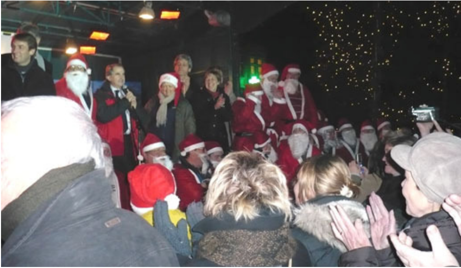
Verwelkoming van de Reuzengilde op het podium.