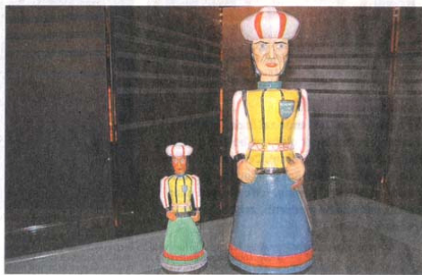
Jan Turpin, in grote en kleine versie.