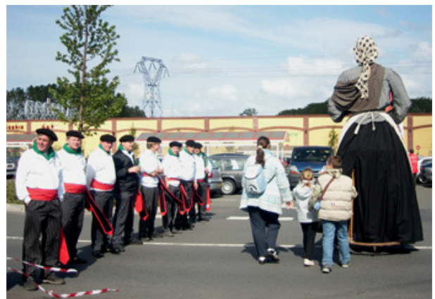
Enkele leden van de Reuzengilde samen met een Reus en leden van andere Gilde.