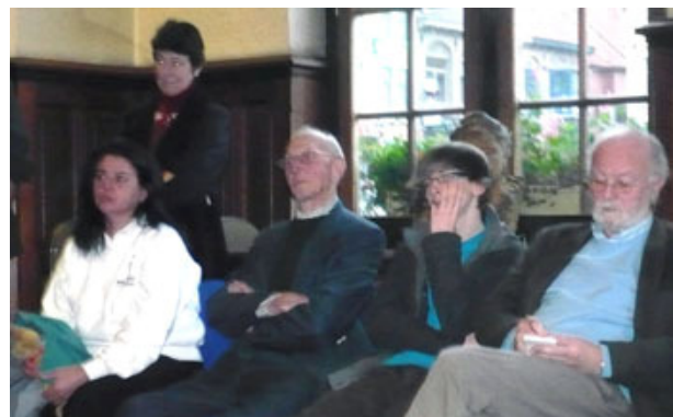
Leden Reuzengilde, sponsor en pers.