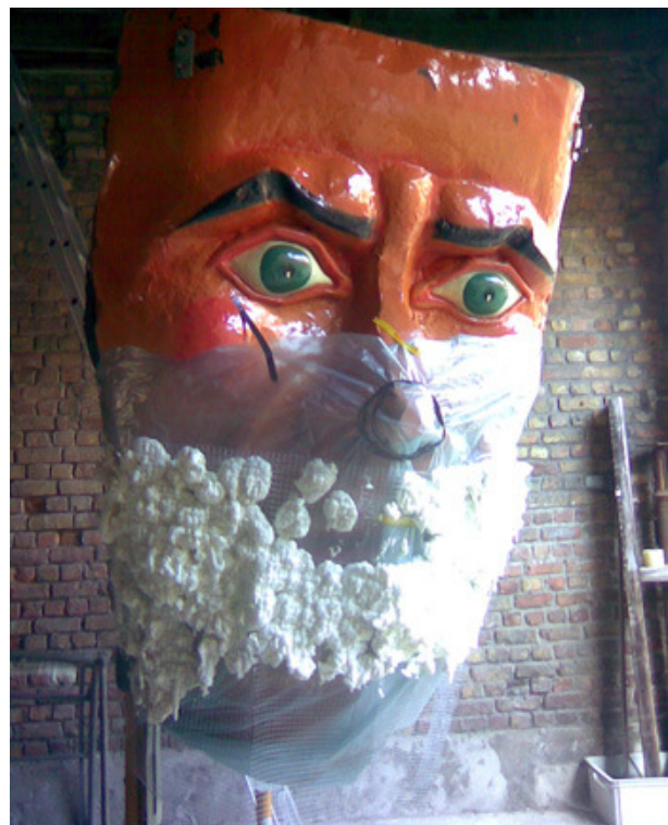
Roland De Groot.