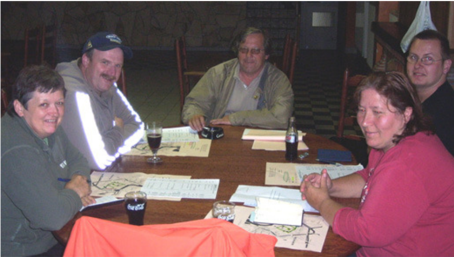
Bestuursvergadering ter inrichting van de Reuzenstoet te Nieuwpoort.