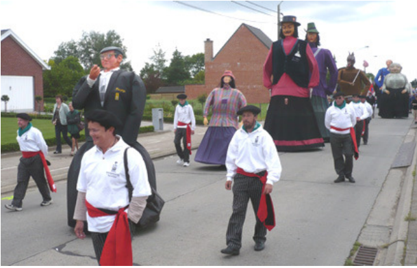
PUUPTJE, ROSALINDE, GOLIATH en GRIETJE