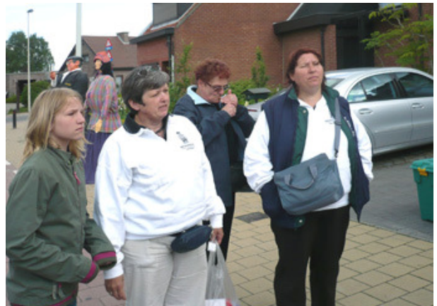
Met een waakzaam oog van de dames worden de andere reuzen klaar gemaakt. Op de achtergrond ziet u de reuzen PUUPTJE en ROSALINDE