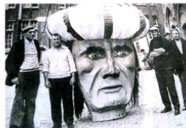
De kop van de reus die tijdens de oorlog onder de grond werd gestoken.